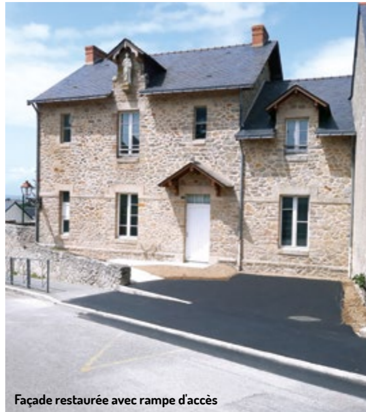
Façade restaurée avec rampe d'accès

L'essentiel des travaux a aussi consisté à reconsidérer totalement les deux anciennes salles de classe, vétustes et difficilement