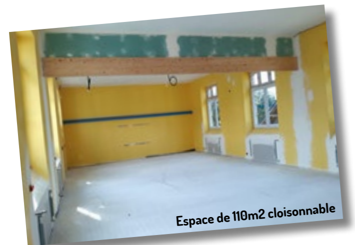
Espace de 110m 2 cloisonnable

sera rapidement exploité par nos associations à caractère strictement culturel et dont les portes leur seront ouvertes à compter du 15 novembre 2019.